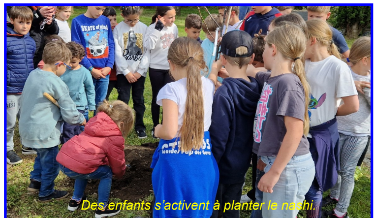
Des enfants s'activent à planter le nashi.

Ici aussi, pour lui témoigner notre vive reconnaissance, et même si sa modestie naturelle en aurait souffert, nous voulons simplement, le remercier pour tout le travail accompli, avec disponibilité, efficacité et surtout la rigueur et la probité de tout bon trésorier qui se respecte.