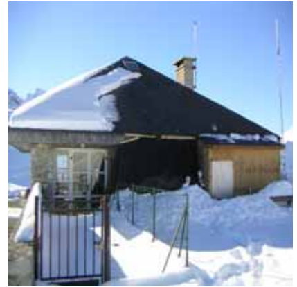
Accueil « le Tramassel »