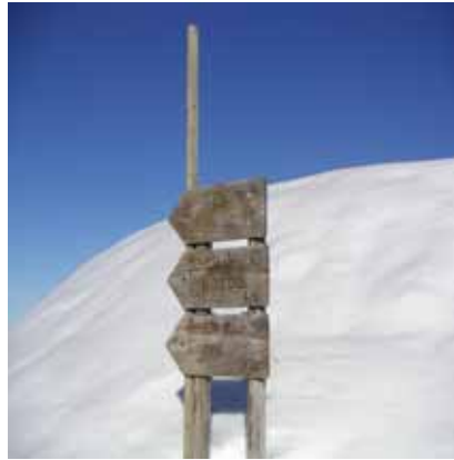
Balisage à l'ancienne