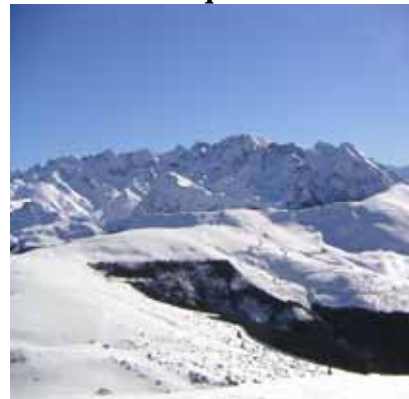
Au fond le Léviste