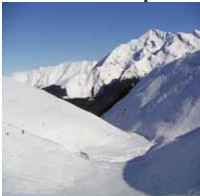
Cabane de Las Courbes