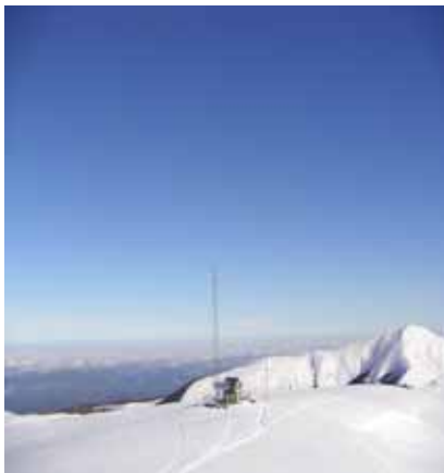
La carotte devant la plaine