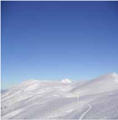
Au fond sou de dabant aygue