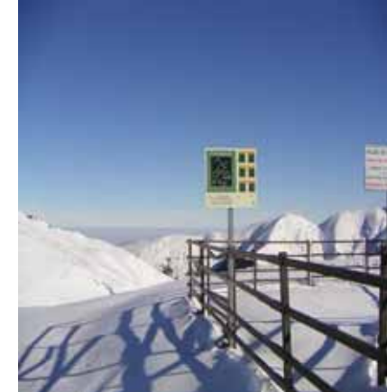
Bargas du Hautacam