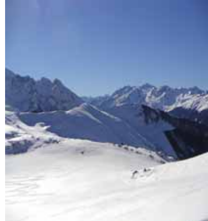
Vue sur le cirque de Gavarnie