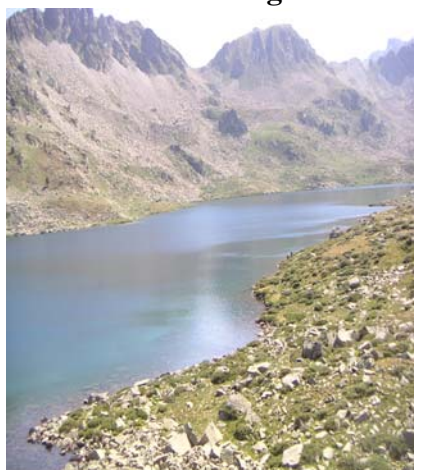
Lac de Bastan ou Portbielh