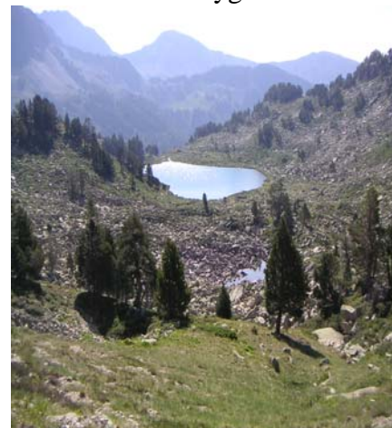
Lac du Gourguet