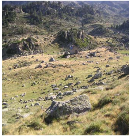
Cabane d'Aygués Cluses