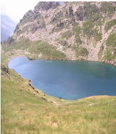
Lac du Gourg Nère