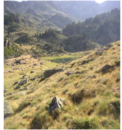
Lac d'Aygués Cluses