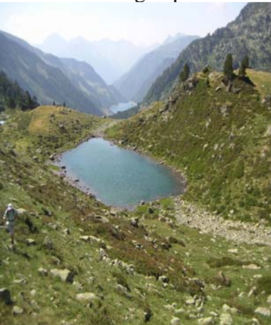
Lac Nère et lac de l'Oule