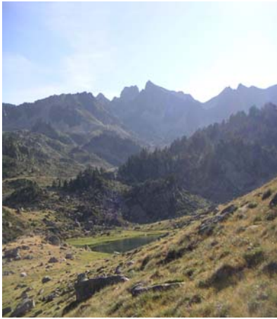
Le lac d'Agalops