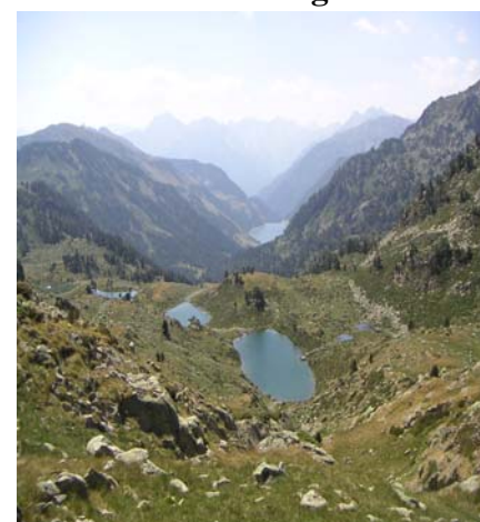
4 laquets de Portbielh