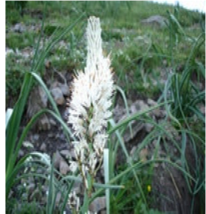
Asphodèle en fleur