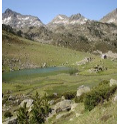
Lac de Coueyla Gran