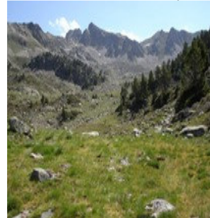
Vers Pas de la Crabe et Hourquette Nere