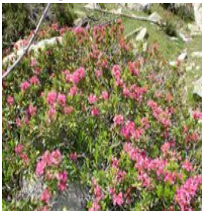
Rhododendrons en fleur