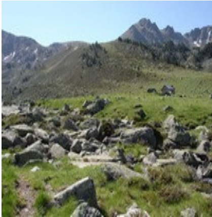
Vers le col de Barèges