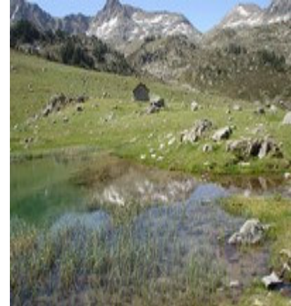
Envahissement d'herbes à Coueyla Gran