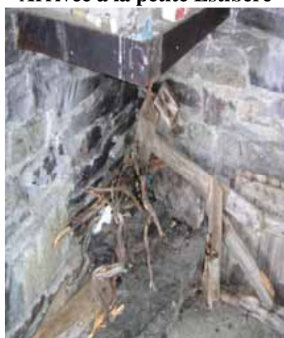
Atre dans la cabane