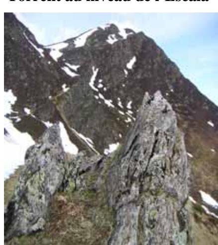
Soum de la Siarrouse face Sud