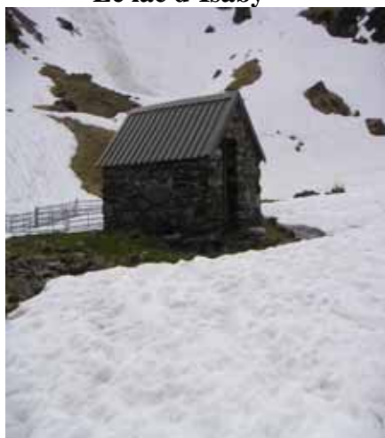
Cabane de la petite Estibère