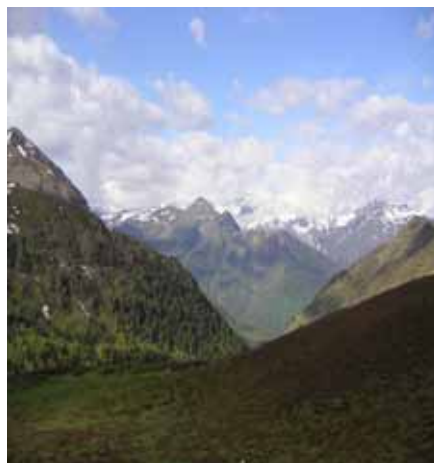
Au loin le Viscos