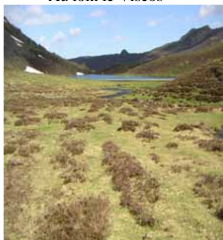
Le lac d'Isaby