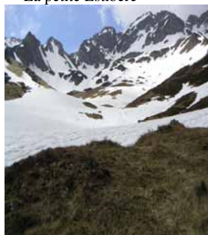
Arrivée à la petite Estibère