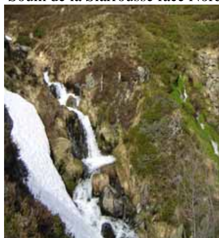
Torrent au niveau de l'Escala