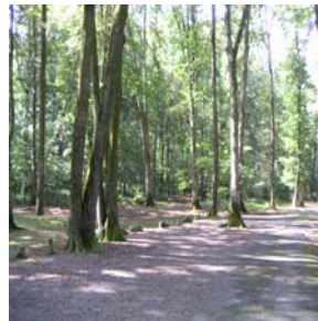
Le parcours sportif