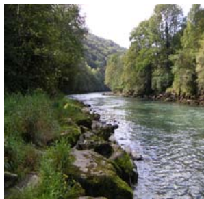
Le gave de Pau