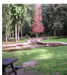
Aire de jeux