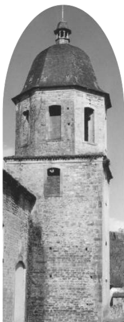
Abbaye de L'Escaladieu

Dans la famille « vente directe de producteurs » : Foie gras, Champagne, Madiran, Pacherenc, Ballotins de chocolats et confiseries, Idées de cadeaux de Noël.