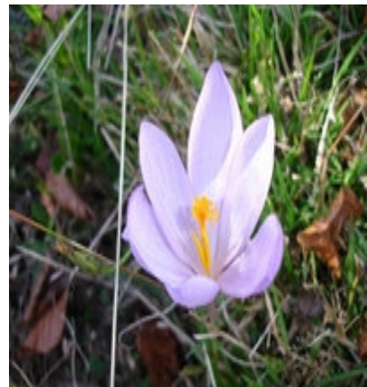
C'est la fin de l'été