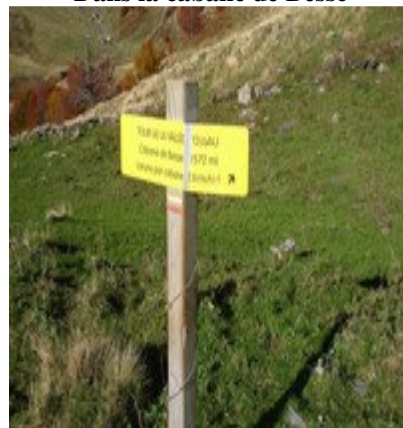
Panneau à la cabane de Besse