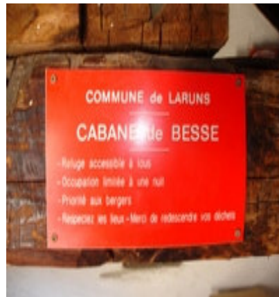
Dans la cabane de Besse