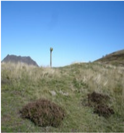
Col de Besse