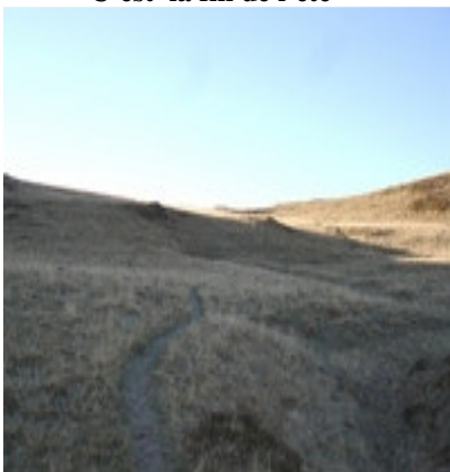
Arrivée au col de Besse