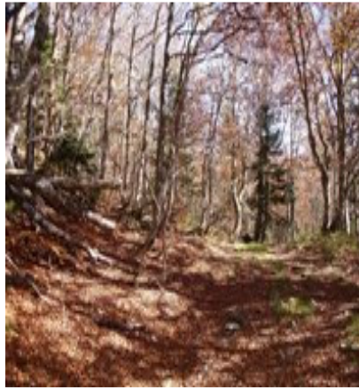
Forêt de Besse