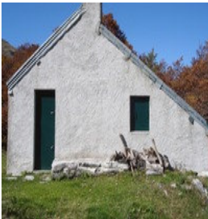
Cabane face à Barthéque