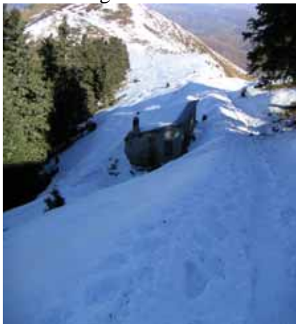
Cabane du sanglier