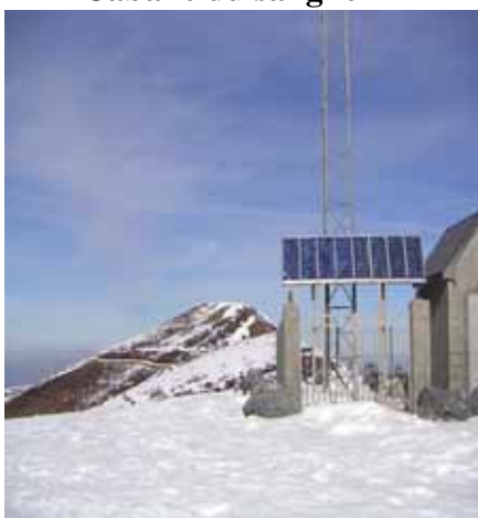
L'altisurface et son relais radio