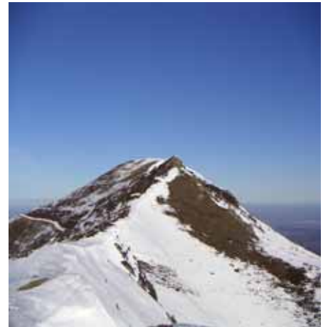
Arête sommitale du Hautacam