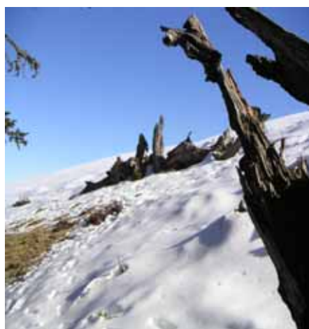
Vestiges des bois