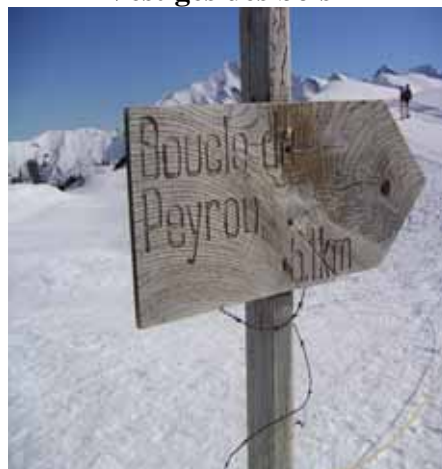
Balisage en cours de disparition