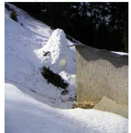
Cabane du sanglier et son igloo