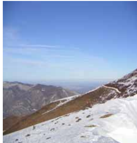
Crêtes du Pibeste en face