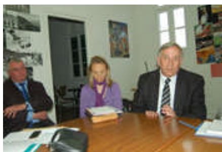
Pendant la conférence de présentation du RIS 2009