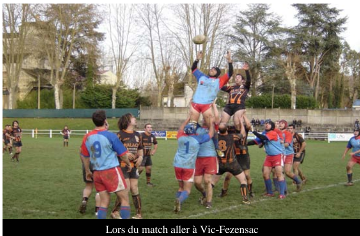
Lors du match aller à Vic-Fezensac

Cette saison, l'équipe locale de rugby réalise une excellente saison. Tous les supporters le savent. Au classement, elle se retrouve dans le haut du tableau de sa poule et se dispute, maintenant à distance, avec Juillan la place de leader. Cette dernière a en effet son importance puisque le club qui terminera en tête au terme de cette première phase qualificative du championnat montera directement en Fédérale 3, c'est-à-dire au niveau supérieur. Défi intéressant quand, si près du but, l'objectif reste possible ! Et il le reste ! A chacun d'une part, avec la motivation indispensable qui donne des ailes, avec le sérieux primordial qui permet des exploits renouvelés, à tous d'autre part, avec l'ambition collective qui réussit à faire déplacer les lignes, avec la solidarité de première nécessité qui fait soulever certains obstacles inhérents à toute vraie conquête, de s'y préparer ! Et, naturellement, acteurs du terrain comme dirigeants du club ! Une équipe, sportive ou non, ne peut briller que si, au complet, elle s'en donne les moyens, tous les moyens ! Au réalisme, toujours obligatoire, associons notre indéfectible volonté, tout aussi essentielle ! Alors viendront satisfactions, récompenses en Honneur !