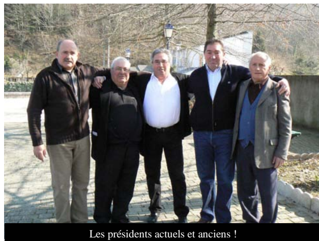
Les présidents actuels et anciens !

Le loto organisé récemment par le club et l'AJUSA a été, une fois de plus une belle réussite. Nous pourrions ajouter comme tous ceux qui ont lieu à Adé et ici nous faisons référence aussi à celui de fin décembre sous l'égide d'Adécole. Les loto, attractifs, ont fait de