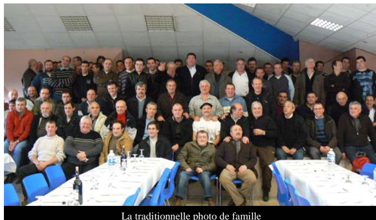
La traditionnelle photo de famille

Le dimanche 22 février, en même temps que les rencontres contre Masseube, les anciens joueurs du club, conviés par leur amicale