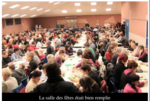
La salle des fêtes était bien remplie

Le bal du lendemain soir a également attiré de nombreux jeunes à la salle des Fêtes du village.