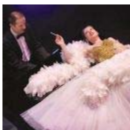
Parlez moi d'humour