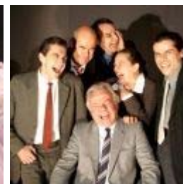
ÉLU. Essai autour d'un buf Théâtre Group' Parlez moi d'humour