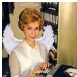
Karl Valentin. Un ange pas l'Atelier Volant Parlez moi d'humour