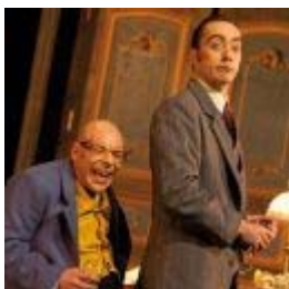
Boulevard du boulevard du Texte et mise en scène Da Parlez moi d'humour