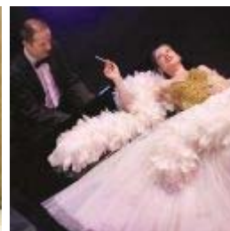
Show de diva Un spectacle jubilatoire p Parlez moi d'humour