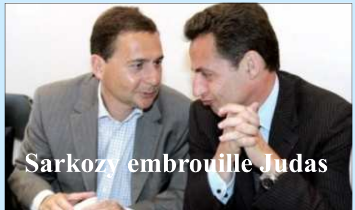
Sarkozy embrouille Judas