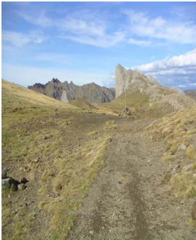
Col de l'Iou