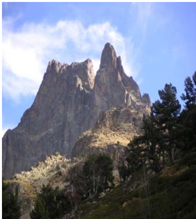
Ossau du bois des Arazures