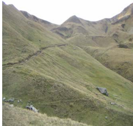
Col de Suzon