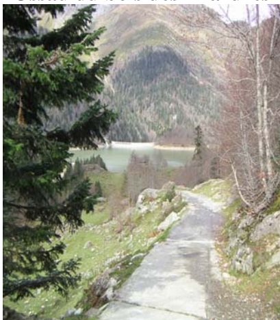
Lac de Bioux-Artigues