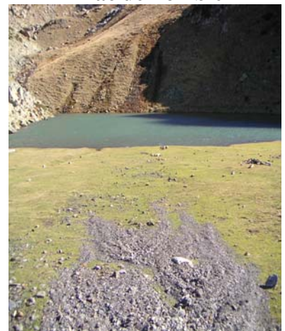
Lac de Peyreget