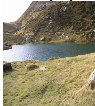
Lac de Pombie