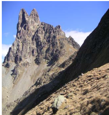
Ossau du lac de Peyreget