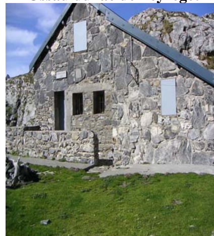
Cabane de Peyreget