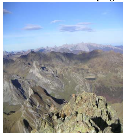
Vue sur les lacs d'Ayous