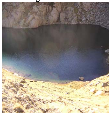
Second lac du col de Peyreget