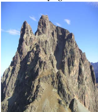
Ossau vu du sommet