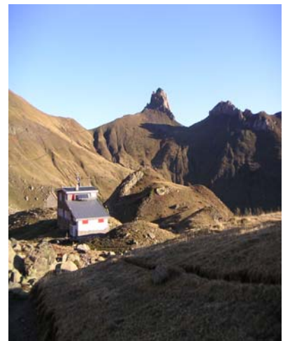
Pic de Saoubiste