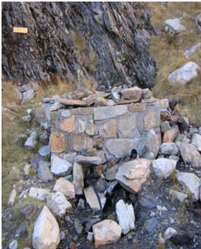
prise d'eau potable du refuge