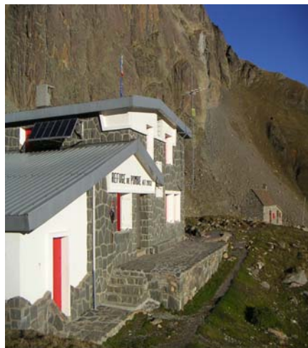
refuge de Pombie