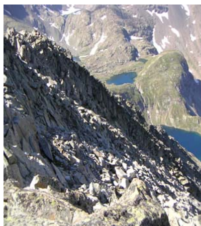
Descente du Pebignaou