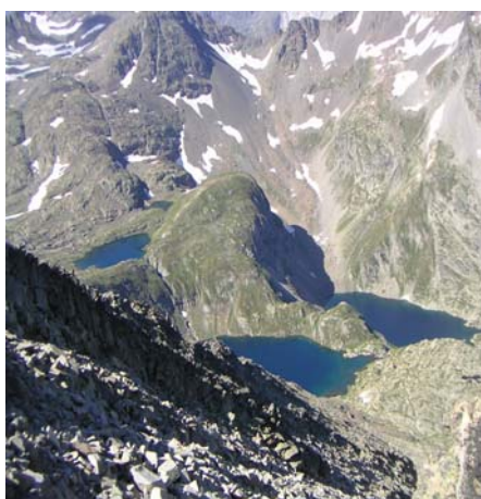
Lac Couy et Labas