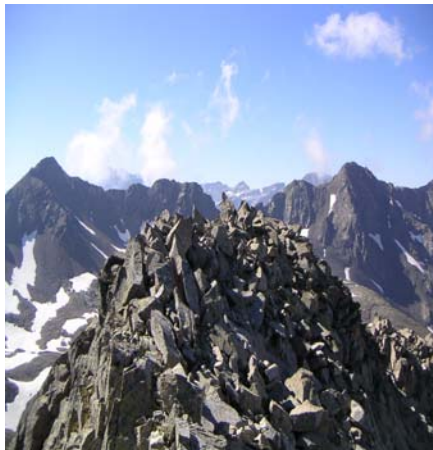
Au fond Brèche de Roland