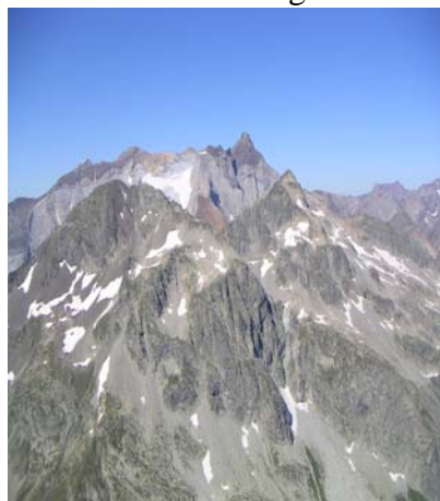
Glacier du Vignemale