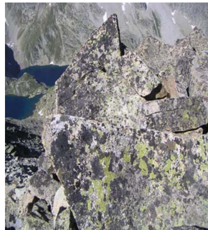
Lac Oulettes d'Estom Soubiran