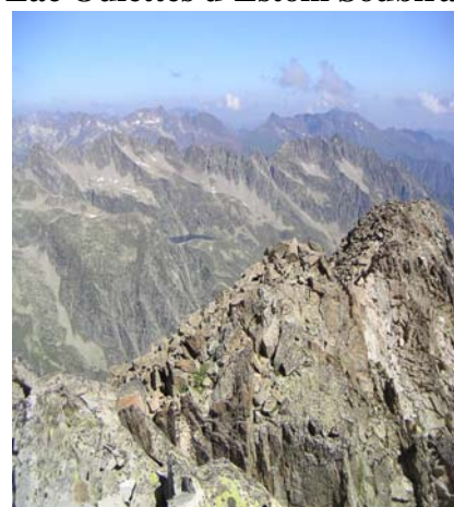
Au fond lacs d'Estibe Aute