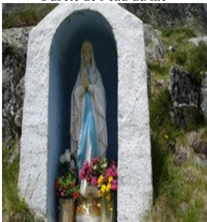
Vierge du lac d'Estom