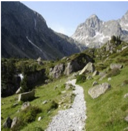
Vers le pic de Labas