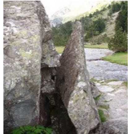
Passage près de la cabane de Pouey Caut