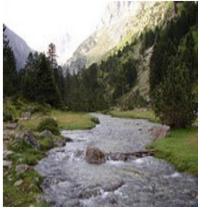
Gave de Lutour