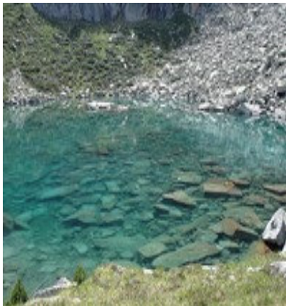
Pureté de l'eau du lac