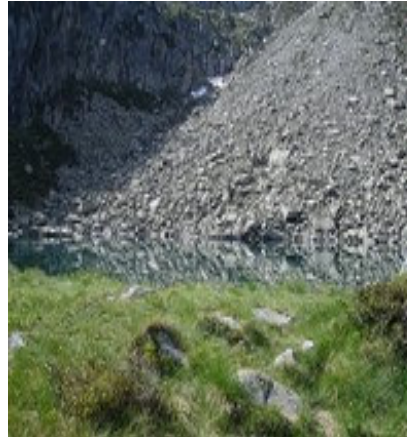
Lac de Hount Hérède