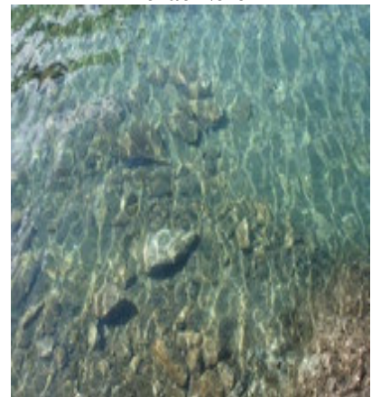
Transparence de l'eau du lac Long