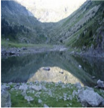
Arrivée au lac Plaa de Prat