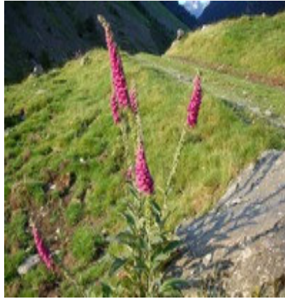
Très joli bouquet