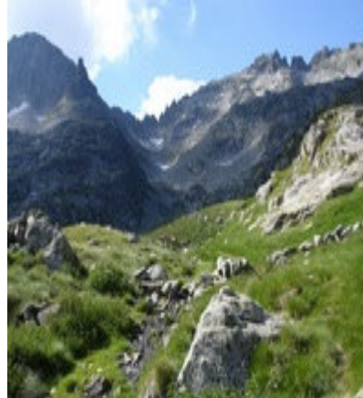
Montée vers le col du Pic Arrouy