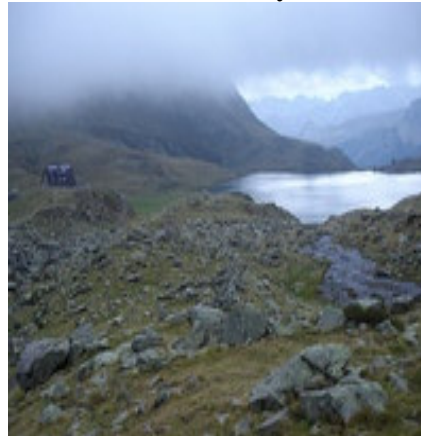
Refuge d'Ayous et lac de Gentau