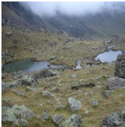
2 laquets sous Bersau