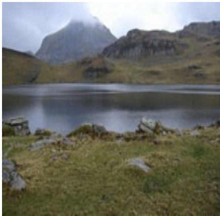
Le lac de Gentau