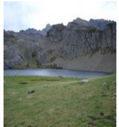
Le lac de Roumassot