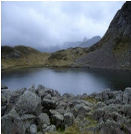
Le lac du Miey