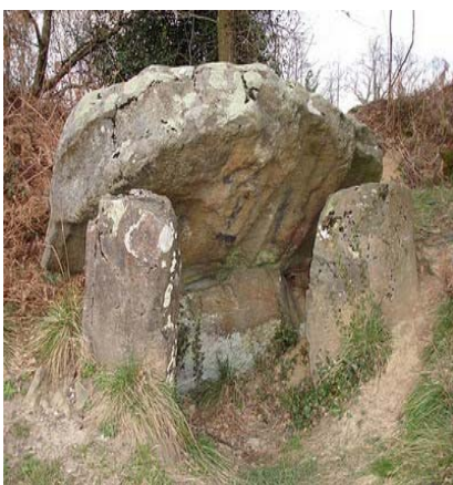
Dolmen de Peyre Dusets