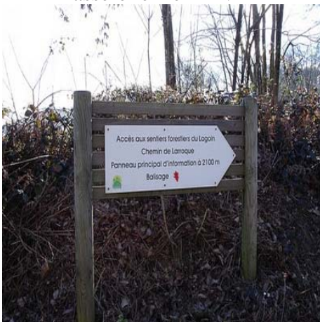
D'autres parcours sur le chemin