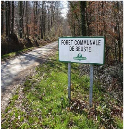
Forêt de Beuste