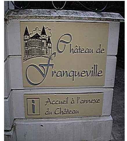
Point de départ