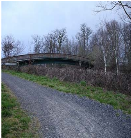
Passerelle Henri IV