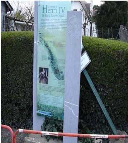
Balisage sur le parcours