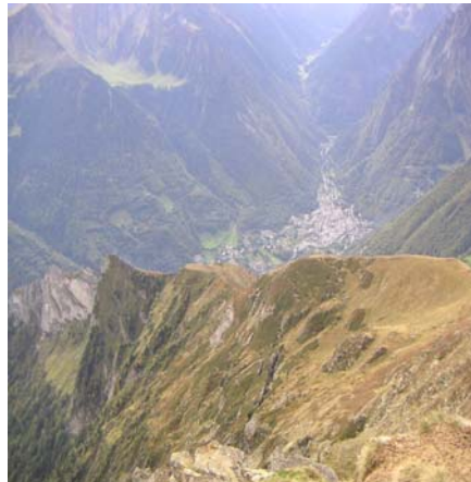
Cauterets et vallée de la Fruitière