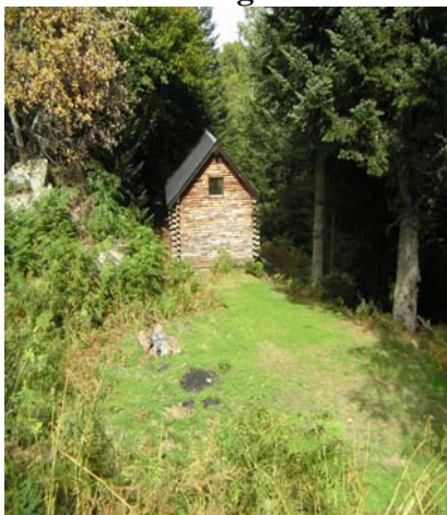
Cabane du bois de la Curadère