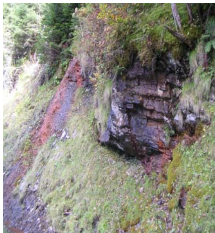
Jeu de couleurs piste de Curadère