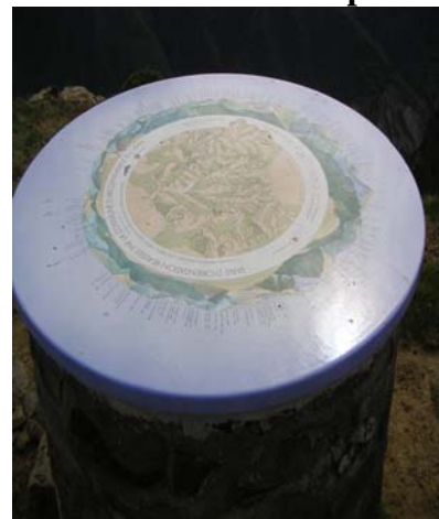
Table orientation du sommet