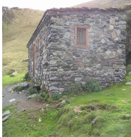
Cabane du turon de bène