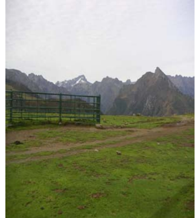
Le Balaïtous au fond