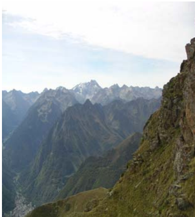
Au fond le Vignemale