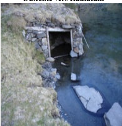
Loge au second lac