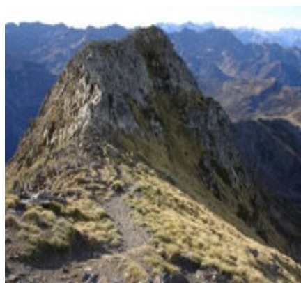
Arête entre les deux pointes