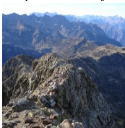
Descente vers Hautacam