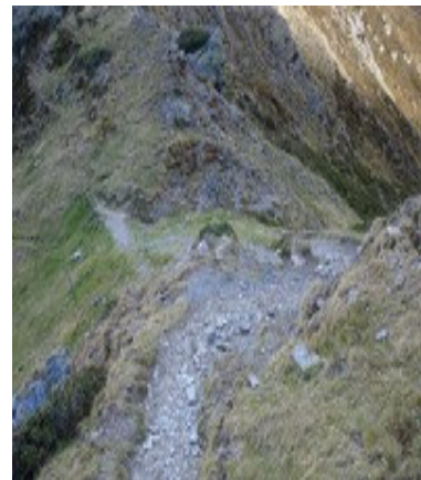
Le col de Tos