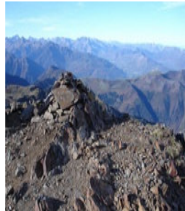
Cairn sommital pointe sud.