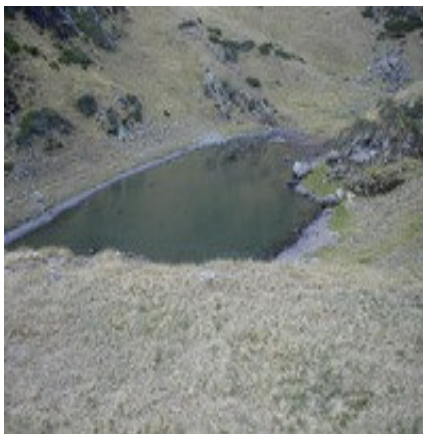
Le premier lac de Montaigu