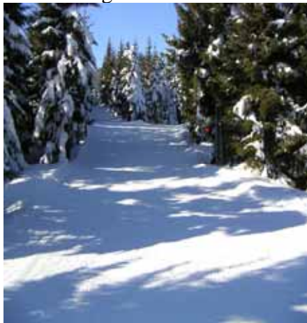
Col de la Serre