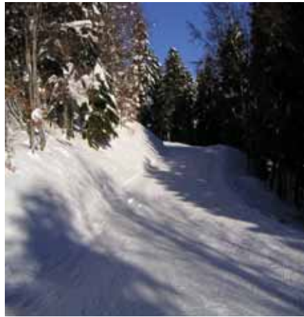
Passage en sous-bois