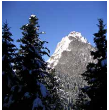
Le pic de Bazès