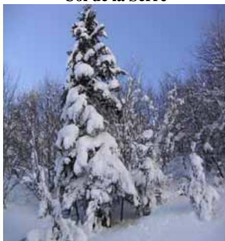
Que de neige