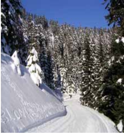
Ecritoire sur neige