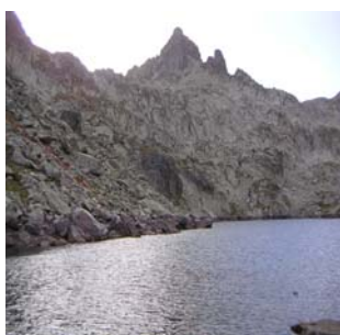
Aiguilles de Castet Abarca