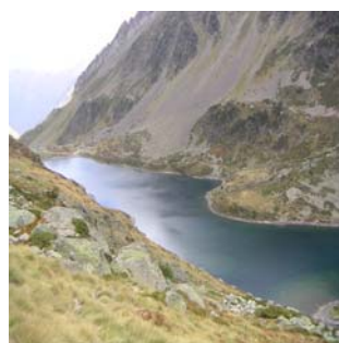
Lac bleu d'Ilhéou