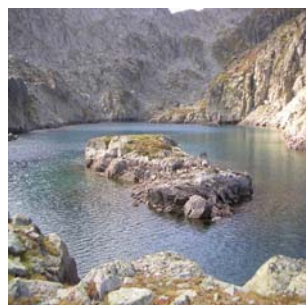
Lac du Hourat