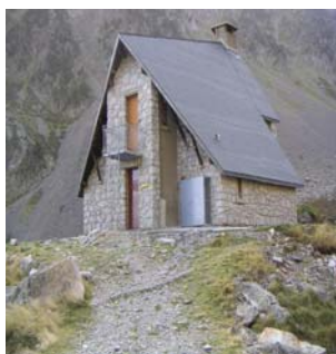
Le refuge d'Ilhéou