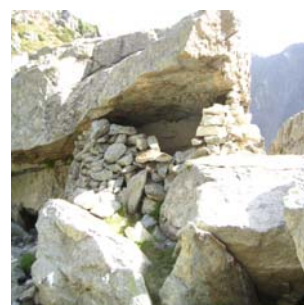
Toue du Hourat