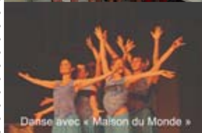
Danse avec « Maison du Monde »