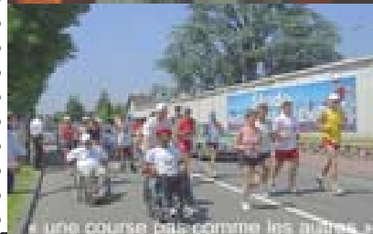
une course pas comme les autres