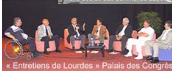
« Entretiens de Lourdes » Palais des Congrès