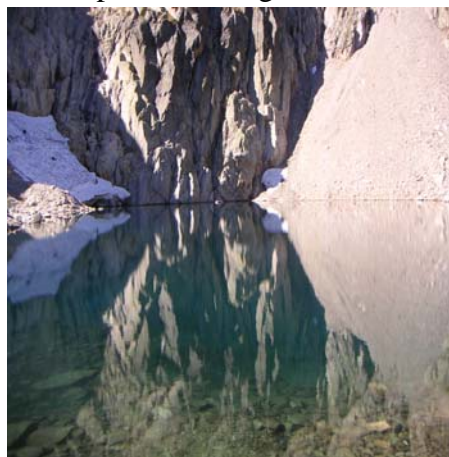
Lac des crêtes de Cambalès