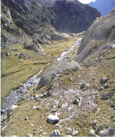
Replat sillonné de ruisseaux