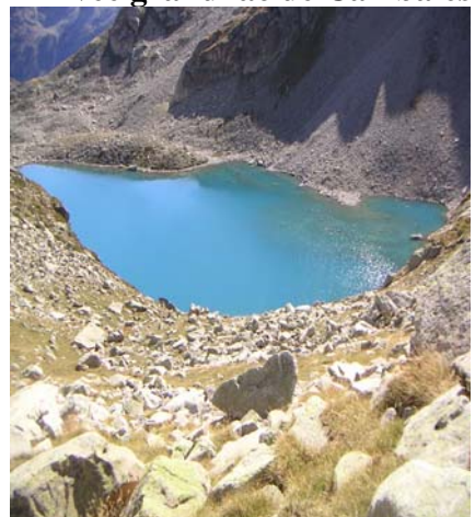
Lac supérieur d'Opale