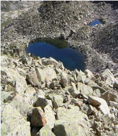
Petit lac des crêtes de Cambalès