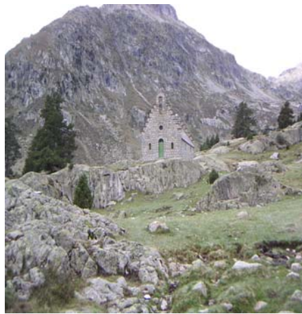
Chapelle du refuge Wallon