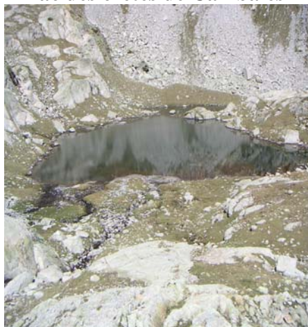
Second lac de Cambalès