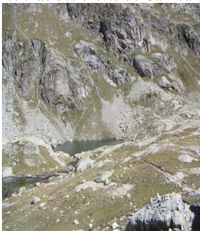
Premier lac de Cambalès