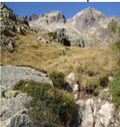
Dernier ressaut avant le lac