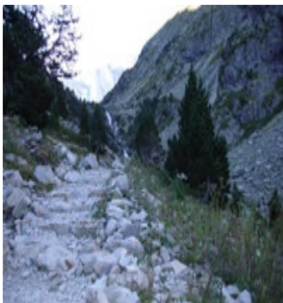
Montée vers la cascade Splumouse