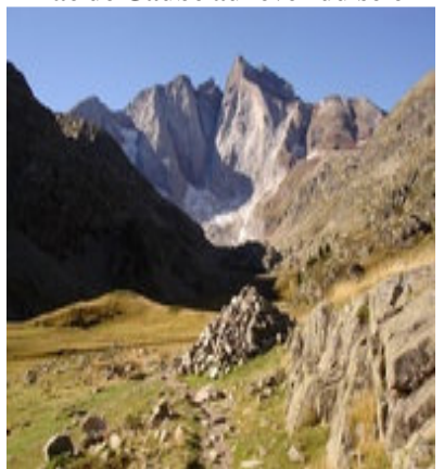
Enorme cairn du début de la montée