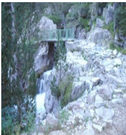
Passerelle sous la cabane du Pinet