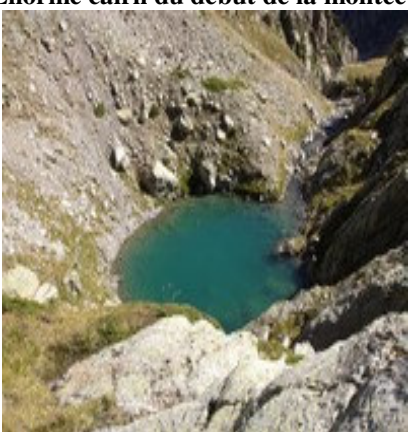
Petit lac avant Chabarrou