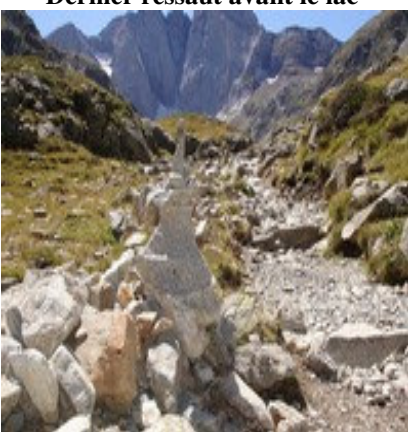
Cairn artistiquement échafaudé