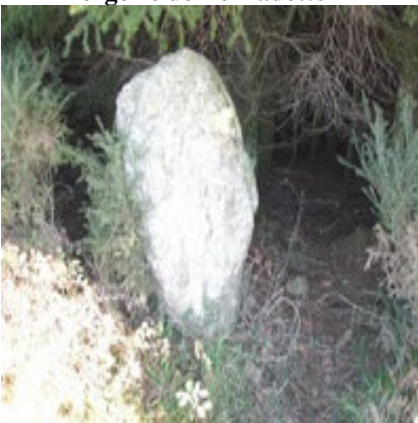
Vestiges de l'âge de bronze ?