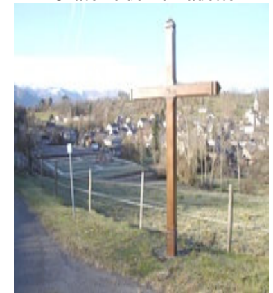
Calvaire au-dessus de Bartrès