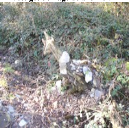
Quel animal étrange