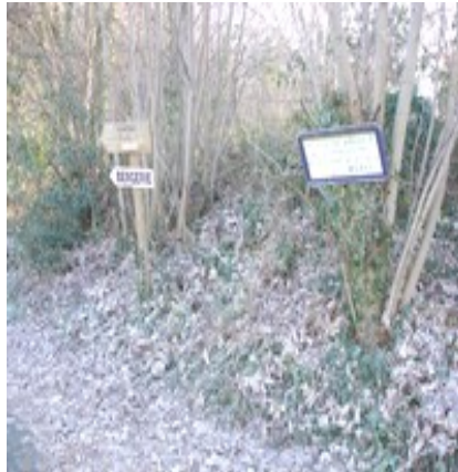
Départ de la randonnée