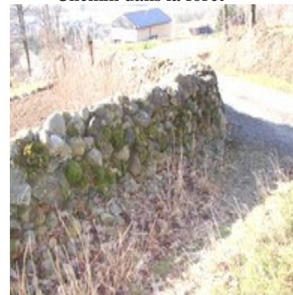
Mur en pierres sèches