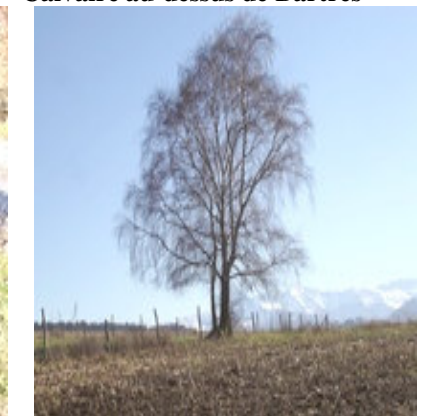
Gardien solitaire de la lande