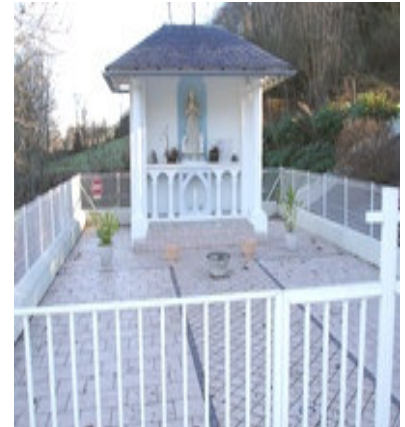
Oratoire de Bernadette