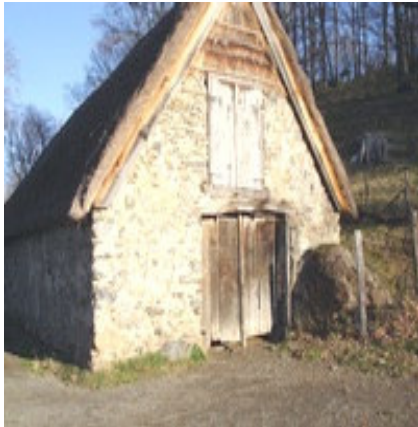
Bergerie de Bernadette