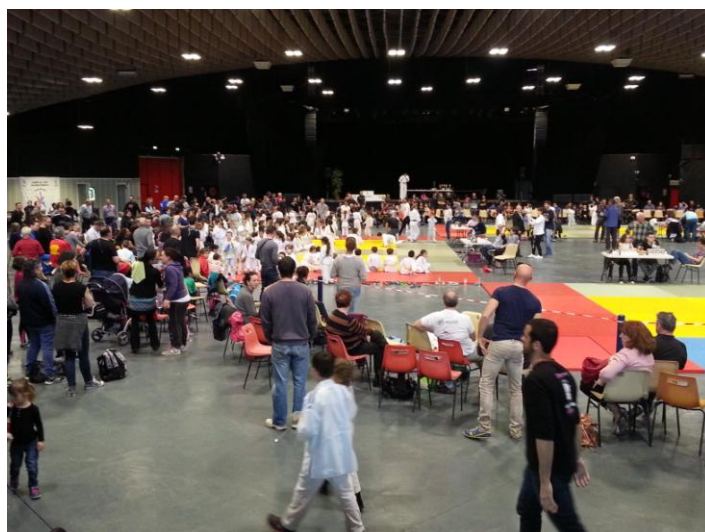
La compétition bat son plein

Cette rencontre amicale se voulait avant tout éducative avec respect des règles édictées par la fédération pour ces catégories d'âges, sous les yeux bienveillants des arbitres du comité départemental que nous remercions au passage pour leur implication.