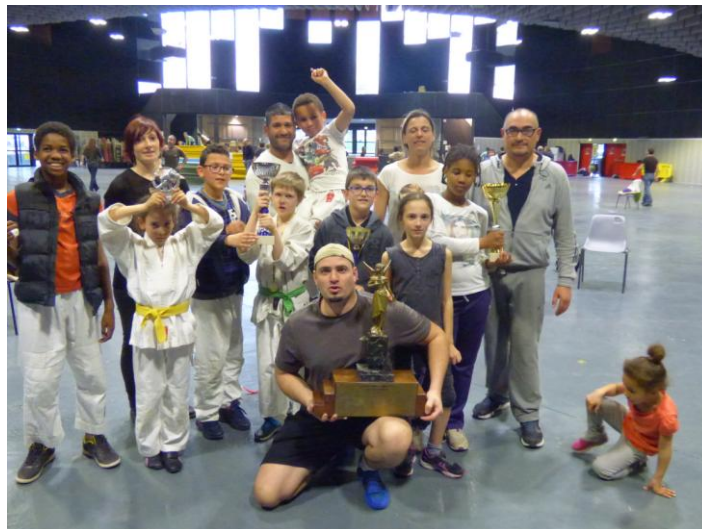
Les grands vainqueurs de la journée, le Stado Tarbais Pyrénées Arts Martiaux

Chaque participant à cette journée est reparti avec sa médaille autour du cou, le trophée et les coupes sont venus récompenser les clubs les plus méritants.