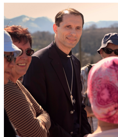
Le pèlerinage diocésain est présidé par Mgr Nicolas Brouwet, évêque de Tarbes et Lourdes.

Un reportage en intégrant une marche ? C'est possible. Contactez-nous pour l'organiser avec les responsables locaux des diverses marches qui partent des 4 coins du département. Informations complémentaires sur www.catholique65.fr