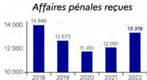
Poursuites délictuelles Citations directes, CRPC, ordonnances pénales, CPV, COPJ et comparutions immédiates