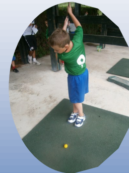
Des activités diverses