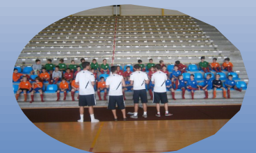
Un encadrement de qualité