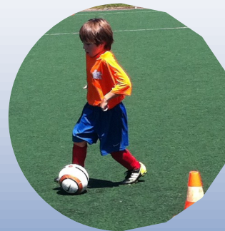
Un suivi personnalisé