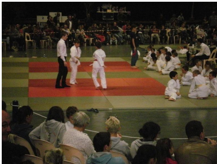
Beaucoup de monde sur et autour des tatamis

Félicitations à tous les judokas qui ont participé à cette fête du judo, dans une ambiance amicale et conviviale.