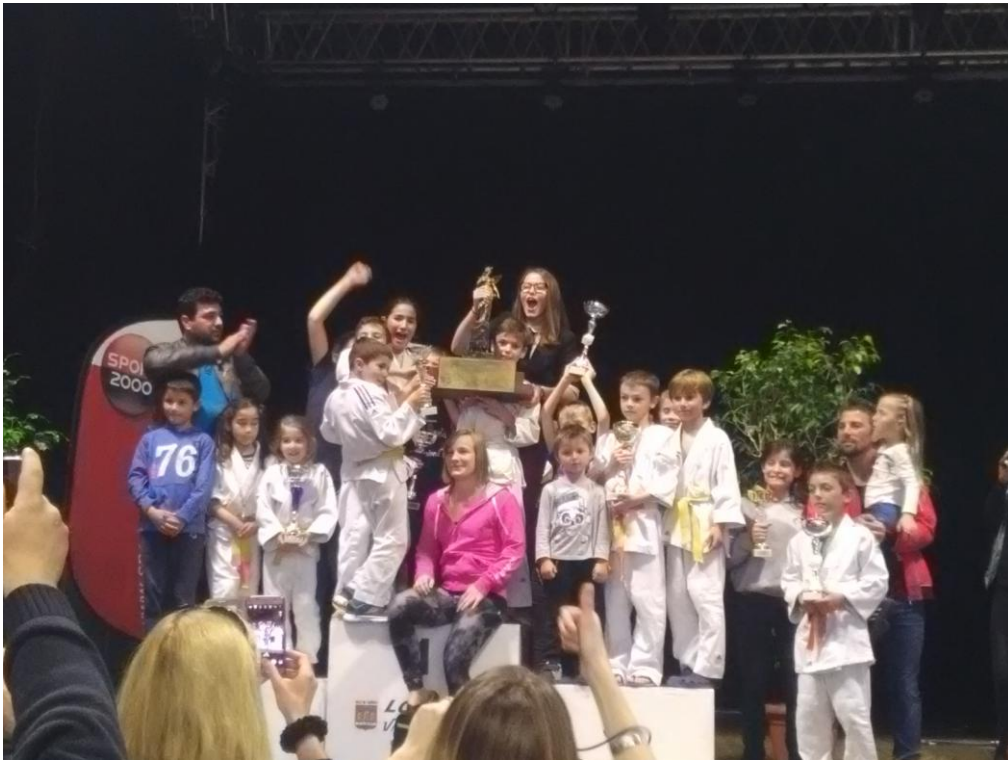
Les jeunes judokas Lourdais avec leur professeur sur la plus haute marche du podium

Cela faisait pas mal d'années que le club attendait de remporter à nouveau le tournoi de la Ville de Lourdes, qu'il organise tous les ans le samedi de Pâques. C'est chose faite!!!