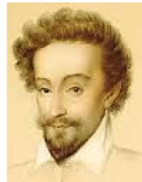
le courageux Henri de Navarre, jeune béarnais à la destinée royale