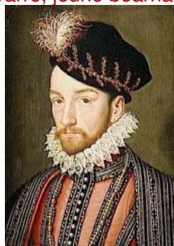
et l'instable Charles IX.

Au temps d'une époque troublée et tumultueuse -les Guerres de Religion-, Marguerite de Valois, dite Margot, fille, sœur et femme de roi, voit sa vie basculer après son mariage avec Henri de Navarre, lors du terrible massacre des protestants, la nuit de la Saint-Barthélemy. Prenant conscience de la violence du pouvoir et des extrêmes où conduit le fanatisme religieux, elle prend à la fois, le visage d'une femme libre, amoureuse, ambitieuse, courageuse et combattante.