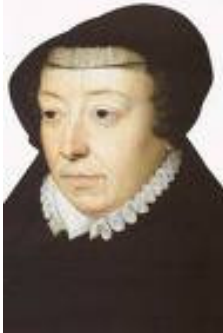
la redoutable Catherine de Médicis,