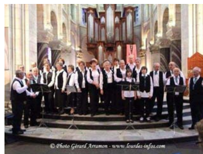
La chorale de Julos en concert