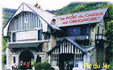
Pic du Jer