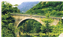
Pont Napoléon (Luz St Sauveur)