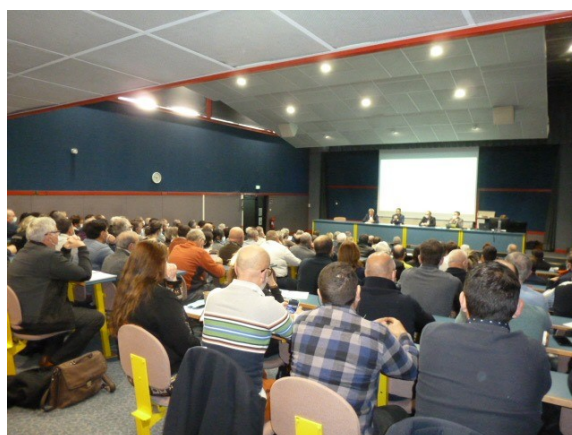
Réunion de travail avec les élus du territoire le 9 novembre 2021